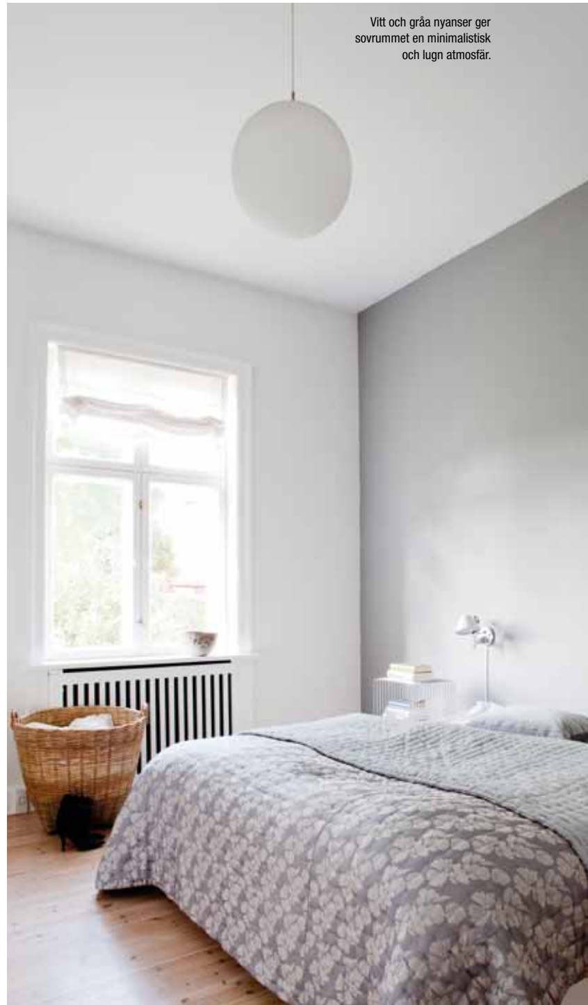
Vitt och gråa nyanser ger sovrummet en minimalistisk och lugn atmosfär.